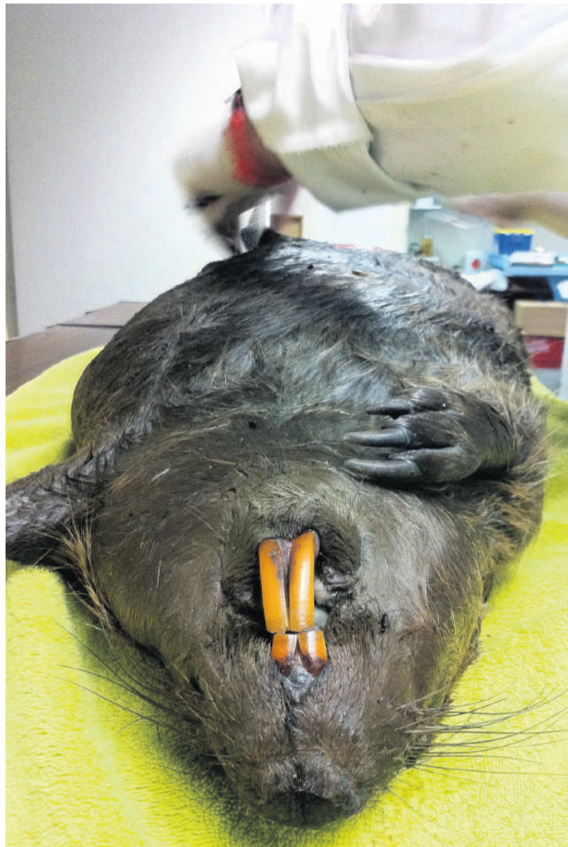
De eerste Rotterdamse bever op de snijtafel.